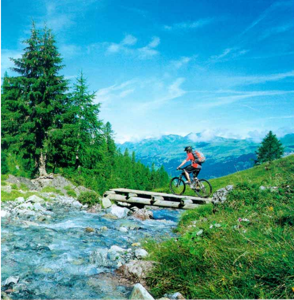
Imafahrt am dritten Tourentag der Freeride-Alpenüberquerung vom Rinerhorn bei Davos hinunter nach Monstein.

Tunnels, Brücken und engsten Kehren. Der neugierige Dillon steckt dabei die Nase derart begeistert aus dem Fenster, dass er fast von einem der vielen Kehrtunnel um einen Kopf kürzer gemacht wird. Hopppla!